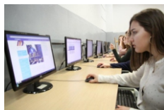
8 pracowni komputerowych